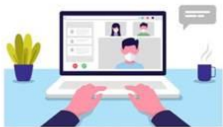
图 1 第一机位示意图

3. 考试前按要求调试好设备，将主机位钉钉全屏显示并开启摄像头。主机位（笔试机位）从正面拍摄，对准考生本人，确保考生双手和头部呈现在拍摄画面中。辅机位（监控机位）从考生侧后方45°拍摄，距离1-2米，确保辅机位能从侧后方清晰显示考生上半身及考试周边环境。调整光线，保证复试组能够从辅机位清晰看到主机位屏幕。屏幕显示效果图如下：