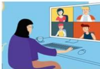
图 2 第二机位拍摄效果示意图

（三）保障网络远程复试网络要求：电脑端和手机端建议采取不同的网络连接模式（有线、无线、移动网络），考生提前测试设备和网络，须保证所有使用设备电量充足（笔试全程要连接充电设备，以防中途没电）、网络流量足够、网络连接正常，能满足初、复试要求。